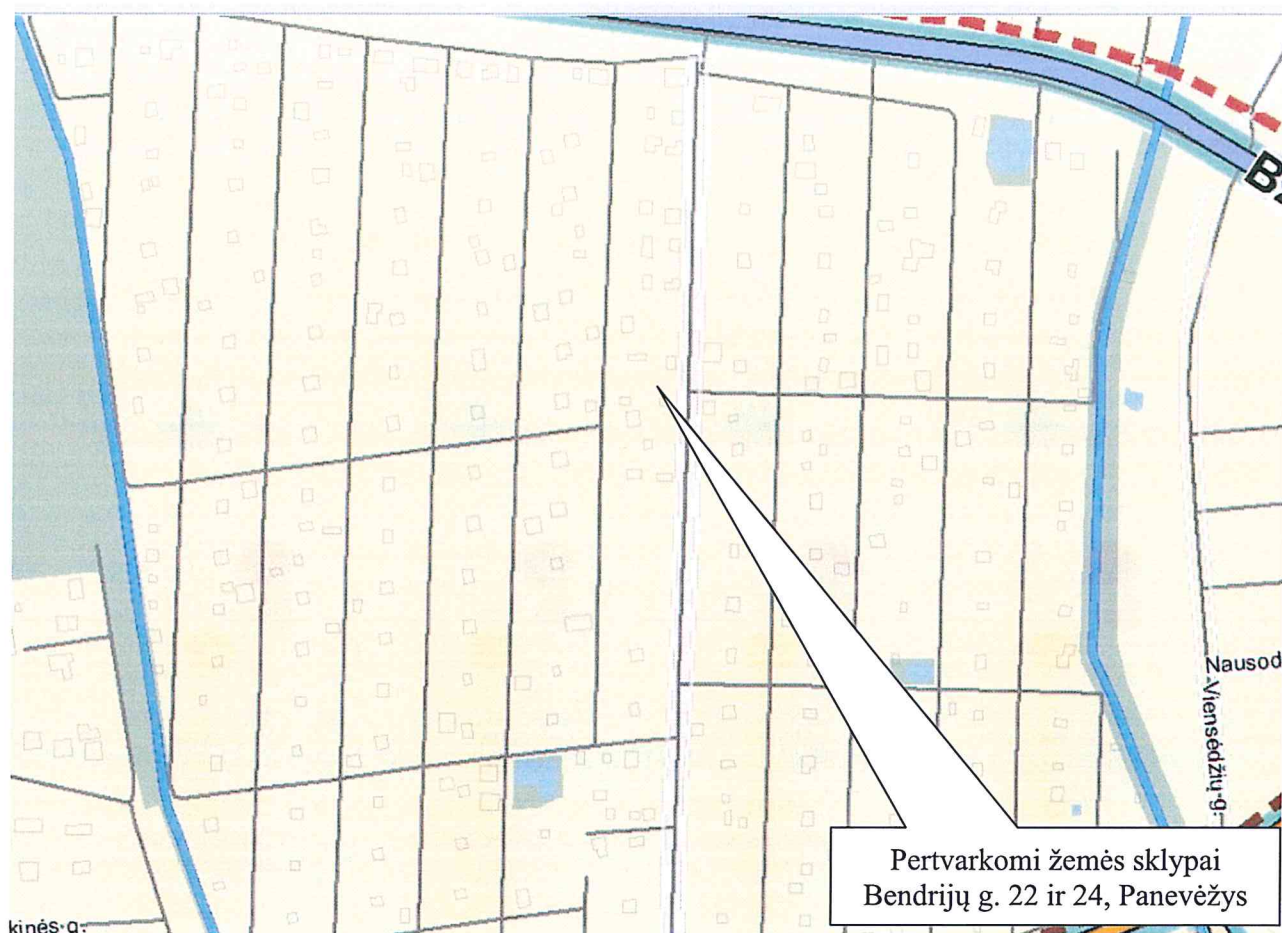
3 pav. Formuojamo žemės sklypo vieta Panevėžio mieste (ištrauka iš Panevėžio miesto teritorijos bendrojo plano sprendinių. Susisiekimo infrastruktūros brėžinys.)